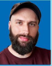
Regionarkivet, VGR & Göteborgs Stad Emil Åhman Arkivarie